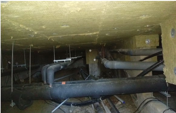
Une retombée d'isolant a été réalisée sur les refends de ce vide sanitaire

Les 12 enseignements détaillés dans ce rapport démontrent l'importance du choix de la solution d'isolation en fonction de la configuration du bâtiment. Les planchers bas, parois horizontales dont seules les faces supérieures donnent sur un local chauffé, peuvent représenter des déperditions thermiques importantes et une source d'inconfort pour les occupants.